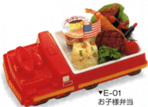
▼E-01 お子様弁当 1,200円(税抜)