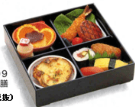
▶D-09 お子様御膳 2,000円(税抜)