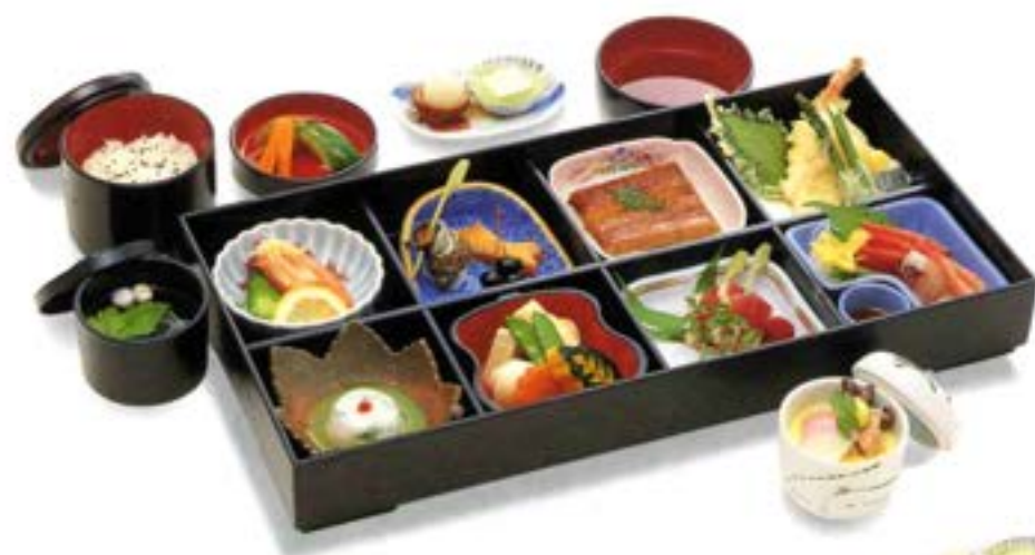
◀D-02 霞(かすみ) 7,000円(税抜)