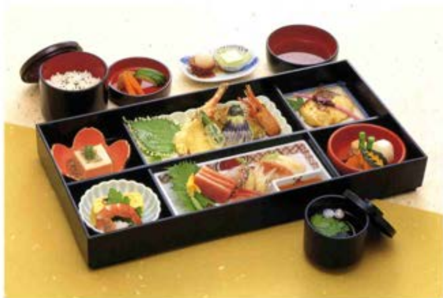
▶D-04 友禅(ゆうぜん) 6,000円(税抜)