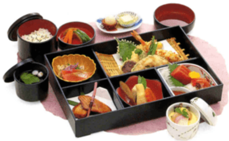
◀D-05 加賀(かが) 5,000円(税抜)