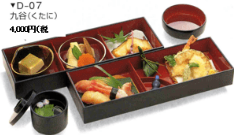
▼D-07 九谷(くたに) 4,000円(税)