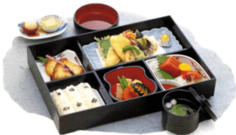
▲D-06 利休(りきゅう) 4,500円(税抜)