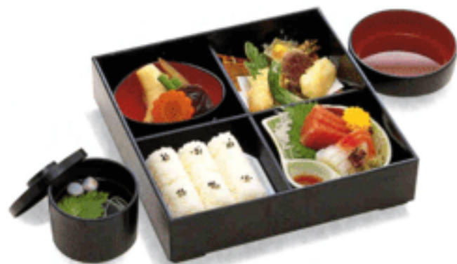
▲D-08 此の花(このはな) 3,000円(税抜)